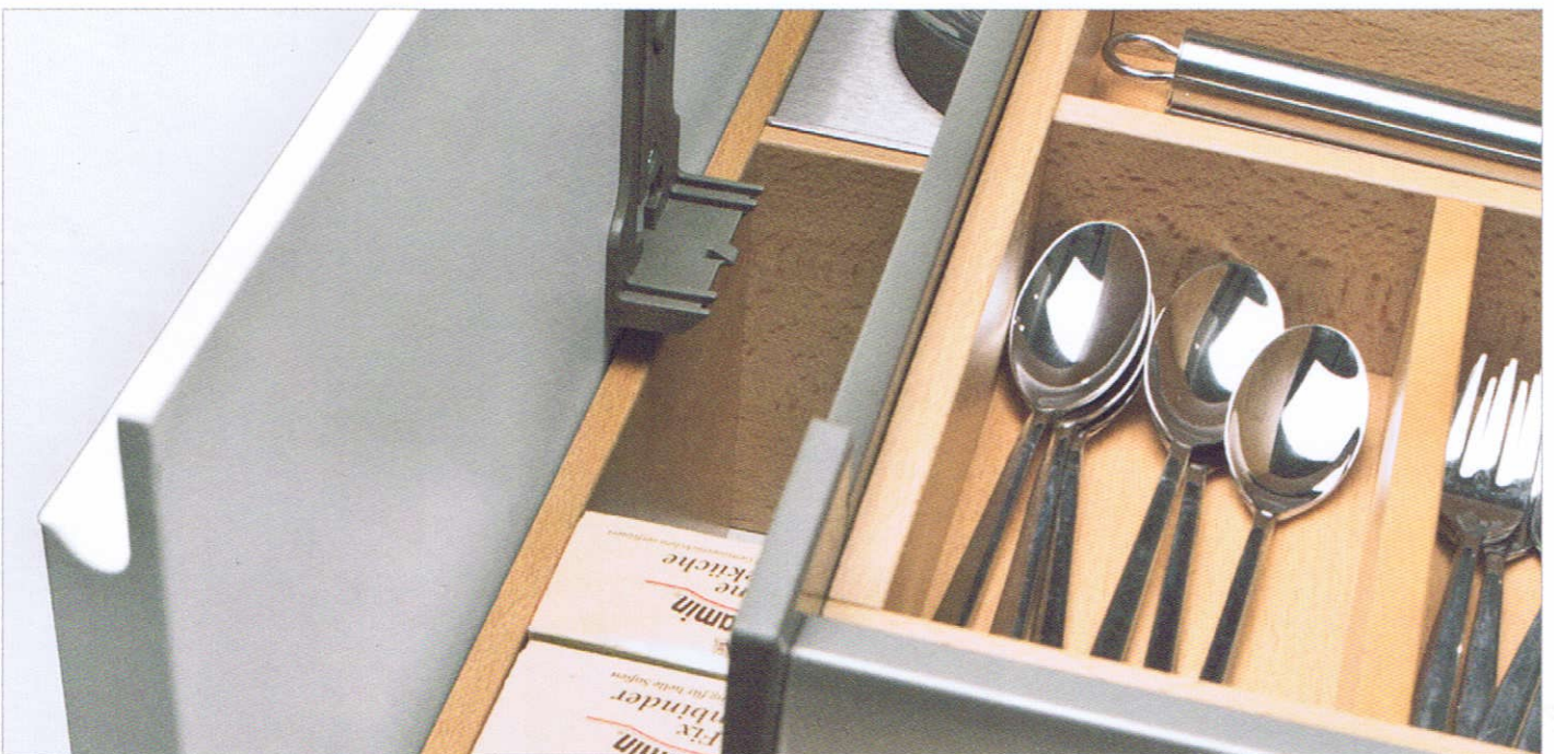
Robust und individuell einteilbar: Schubladeneinsatz aus Echtholz