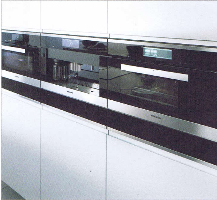
Einbaugeräte von Miele