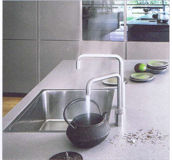
Sofort 100°C heißes Wasser – Tea Time – spontan und jederzeit

Vergessen Sie komplizierte Bedienungsanleitungen: Wir erklären Ihnen persönlich alle Funktionen, Details und Raffinessen der neuen Geräte, damit Sie sofort Freude am Kochen haben können. Wir finden: Innovative Technik soll das Leben leichter, nicht komplizierter machen. Dafür sorgen wir.